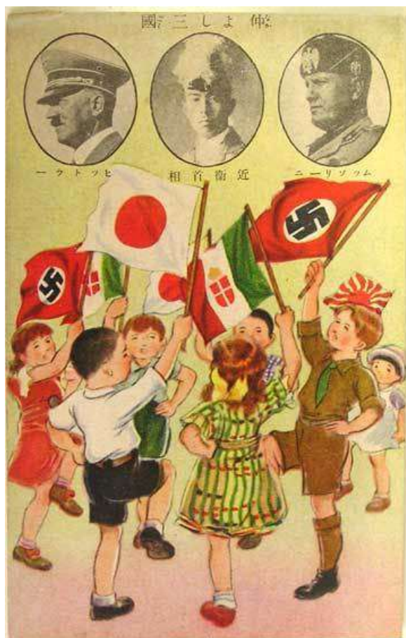
Японский плакат, пропагандирующий сотрудничество стран Оси в 1938 году. Неизвестный художник Из Антикоминтерновского пакта, 1936 г.

Агрессивность Японии и Германии, неэффективность Лиги Наций заставляли искать новые механизмы обуздания агрессоров. Получила популярность идея создания системы коллективной безопасности, в рамках которой страны брали бы на себя обязательства выступать в качестве гарантов нерушимости границ и оказать друг другу помощь в случае агрессии. Больше всего сторонников у этой идеи было во Франции и в СССР, последний в 1934 г. вступил в Лигу Наций и был серьёзно обеспокоен усилением Германии. Советский Союз опасался «войны на два фронта», а также того, что большая война может разразиться раньше, чем завершится индустриализация и модернизация его армии. Поэтому нарком иностранных дел М. М. Литвинов (1876–1951) делал всё возможное, чтобы войну предотвратить. В 1935 г. были подписаны договоры о взаимной помощи между СССР, Францией и Чехословакией.