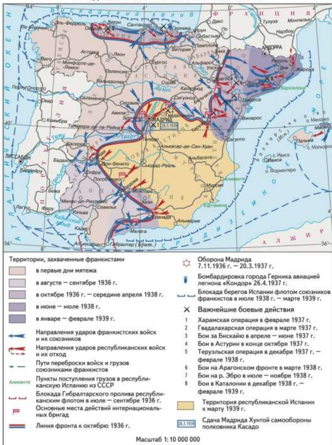
ГРАЖДАНСКАЯ ВОЙНА В ИСПАНИИ 1936–1939 гг.

Гражданская война в Испании 1936–1939 гг. Цит. по: Пожарская С. П. Испанская революция 1931–39 // Большая российская энциклопедия. Электронная версия (2016)