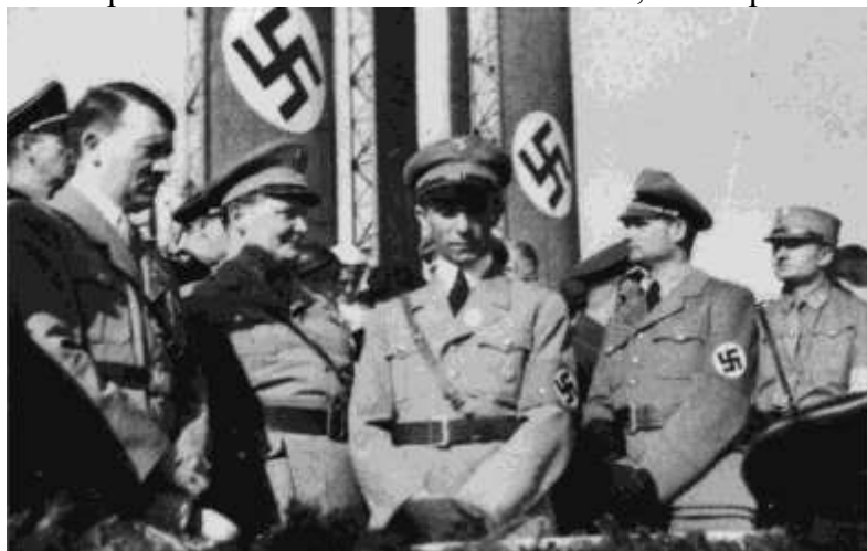
Гитлер, Геринг, Геббельс и Рудольф Гесс во время военного парада в 1933 году. Фотография неизвестного автора

особенно Англии не верили, что Германия сможет быстро восстановить военный потенциал даже в случае снятия ограничений — а если и восстановит, то направит агрессию на Восток, где столкнется с СССР.